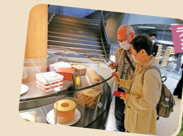
ラコリーナ近江八幡